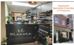
Restaurant Spécialité Couscous et Fraises